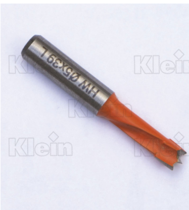
САВИНЕО® HW Z = 2 СОЕДИНЕНИЯ