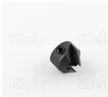
СЧЕТЧИКИ HW Z = 2