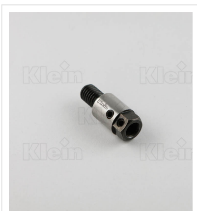
ШПИНДЕЛИ С РЕЗЬБОВЫМ СОЕДИНЕНИЕМ - (M10)