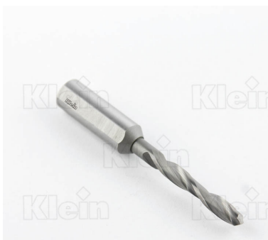
СВЕРЛА ИЗ КОМПОНЕНТОВ HW ДЛЯ ГЛУБОКИХ ОТВЕРСТИЙ Z = 2