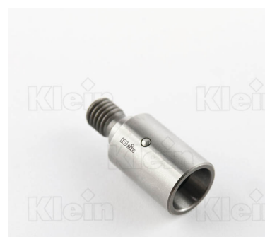
ДЕРЖАТЕЛЬ ДЛЯ БЫСТРОЙ ЗАМЕНА ПАТРОНОВ