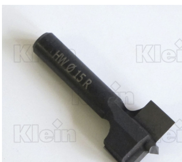
SABINEO® HW Z = 2 СОЕДИНЕНИЯ