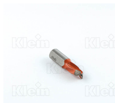
СВЕРЛА ДЛЯ ГЛУБОКИХ ОТВЕРСТИЙ Z = 2