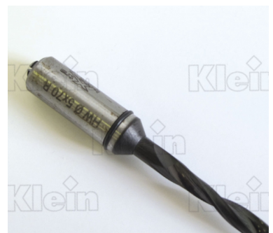
СВЕРЛА ДЛЯ ПРОХОДНЫХ ОТВЕРСТИЙ "ХТРАВОРЕ®" В INTEGRAL HW Z = 2 - С ПОКРЫТИЕМ KleinDIA®