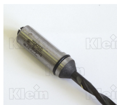
НАКОНЕЧНИКИ "XTRAVORE®" В ИНТЕГРАЛЬНОМ ОБОРУДОВАНИИ ДЛЯ ГЛУБОКИХ ОТВЕРСТИЙ Z = 2. С ПОКРЫТИЕМ L116.KD-L117.KD