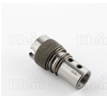
СВЕРЛИЛЬНЫЕ ПАТРОНЫ ДЛЯ БЫСТРОЙ ЗАМЕНА