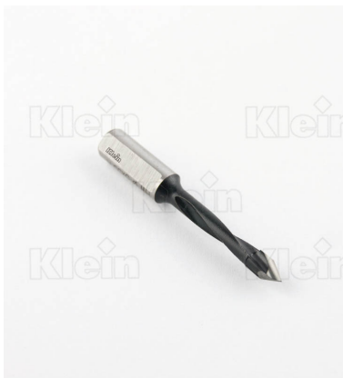
КОМПОНЕНТНЫЕ СВЕРЛА HW ДЛЯ ПРОХОДНЫХ ОТВЕРСТИЙ Z = 2