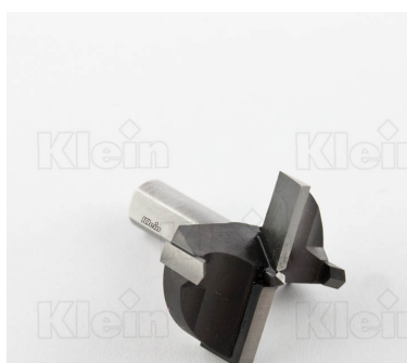
СОВЕТЫ ДЛЯ HW Z = 2 + 2 ПЕТЛИ