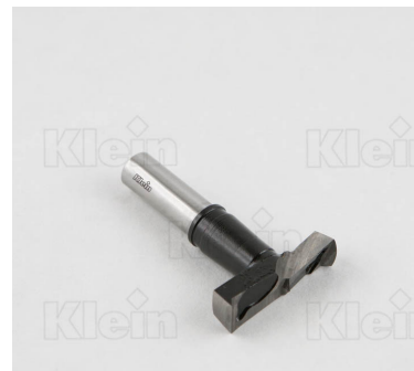
СОВЕТЫ ПО ВСТРОЕННЫМ ПЕТЛЯМ Z = 2 + 2