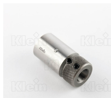
СВЕРЛИЛЬНЫЕ ПАТРОНЫ ДЛЯ БЫСТРОЙ ЗАМЕНА