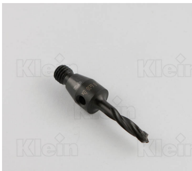
БЛОКИРОВКИ HW БЕЗ ПОВЕРХНОСТИ Z = 2