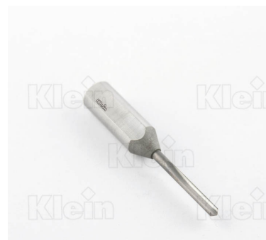
AMBIDESTROUS КОМПОНЕНТНЫЕ ТОЧКИ ОБОРУДОВАНИЯ Z = 1