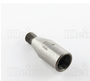
ДЕРЖАТЕЛЬ ДЛЯ БЫСТРОЙ ЗАМЕНА ПАТРОНОВ