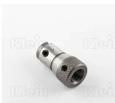
СВЕРЛИЛЬНЫЕ ПАТРОНЫ ДЛЯ БЫСТРОЙ ЗАМЕНА