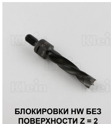
БЛОКИРОВКИ HW БЕЗ ПОВЕРХНОСТИ Z = 2