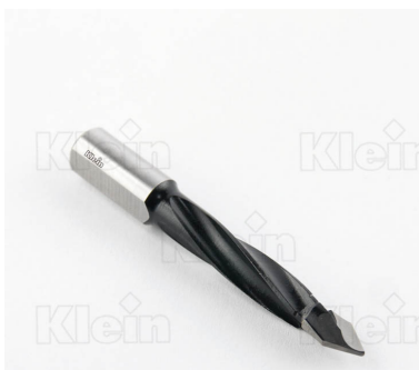
КОМПОНЕНТНЫЕ СВЕРЛА HW ДЛЯ ПРОХОДНЫХ ОТВЕРСТИЙ Z = 2