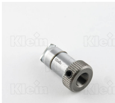
СВЕРЛИЛЬНЫЕ ПАТРОНЫ ДЛЯ БЫСТРОЙ ЗАМЕНА