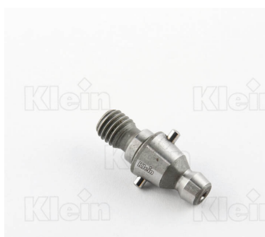
СВЕРЛИЛЬНЫЕ ПАТРОНЫ ДЛЯ БЫСТРОЙ ЗАМЕНА