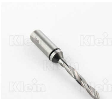
КОМПОНЕНТНЫЕ СВЕРЛА HW ДЛЯ ПРОХОДНЫХ ОТВЕРСТИЙ Z = 2