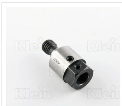
ШПИНДЕЛИ С РЕЗЬБОВЫМ СОЕДИНЕНИЕМ - (M10 / 11x4)

К сверлам и шпинделям для сверлильных станков относятся: спиральные сверла, сверла для глухих отверстий, сверла для сквозных отверстий, сверла для шарниров, сверла для дюбелей, сверлильные патроны для быстросменных сверлильных станков, сверла для сверл, сверла для сверления дерева, сверла для петли, сверлильные патроны, сверла для сверлильных станков с ЧПУ, зенковки, дюбели, сверла для отверстий по МДФ.