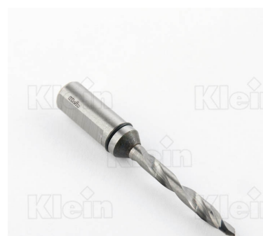
КОМПОНЕНТНЫЕ СВЕРЛА HW ДЛЯ СЕРИИ "ЕТ" Z = 2 ПРОХОДНЫХ ОТВЕРСТЯ