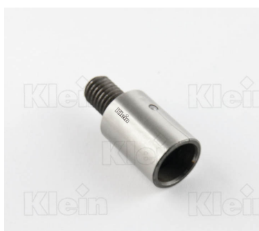
ДЕРЖАТЕЛЬ ДЛЯ БЫСТРОЙ ЗАМЕНА ПАТРОНОВ