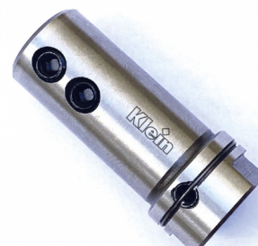
СВЕРЛИЛЬНЫЕ ПАТРОНЫ ДЛЯ БЫСТРОЙ ЗАМЕНА