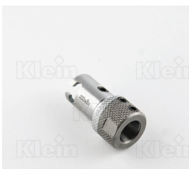
ДЕРЖАТЕЛЬ ДЛЯ БЫСТРОЙ ЗАМЕНА ПАТРОНОВ