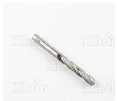
ИНТЕГРАЛЬНЫЕ СВЕРЛА ДЛЯ СПИРАЛЬНОЙ СВЕРЛЫ Z = 2