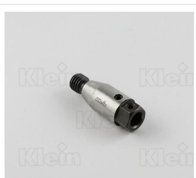
ШПИНДЕЛИ С РЕЗЬБОВЫМ СОЕДИНЕНИЕМ - (M10 / 30 °)