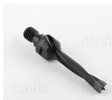
HW ДОПОЛНИТЕЛЬНЫЕ КОЛОНКИ С ПЕРЕГОРОДКОЙ Z = 2