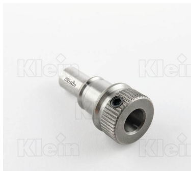
ШПИДЕЛИ ДЛЯ АВТОМАТИЧЕСКОЙ СМЕНА "BIESSE"