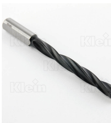
СВЕРЛА ИЗ КОМПОНЕНТОВ HW ДЛЯ ГЛУБОКИХ ОТВЕРСТИЙ Z