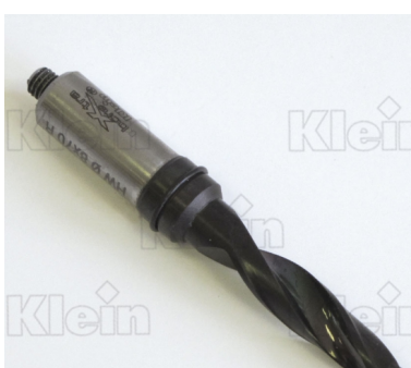
СВЕРЛА ДЛЯ ПРОХОДНЫХ ОТВЕРСТИЙ "ХТРАВОРЕ®" В СЕРИИ INTEGRAL HW Z = 2 "ЕТ", С ПОКРЫТИЕМ KleinDIA®