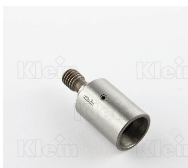
ДЕРЖАТЕЛЬ ДЛЯ БЫСТРОЙ ЗАМЕНА ПАТРОНОВ