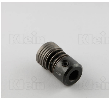
СВЕРЛИЛЬНЫЕ ПАТРОНЫ ДЛЯ БЫСТРОЙ ЗАМЕНА