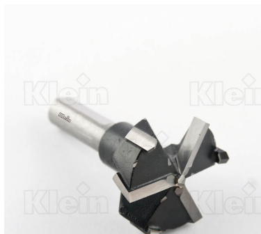
СОВЕТЫ ДЛЯ HW Z = 3 + 3 ПЕТЛИ