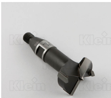
СОВЕТЫ ДЛЯ HW Z = 2 + 2 ПЕТЛИ