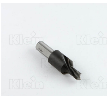
ТОЧКИ БЫСТРОГО СОЕДИНЕНИЯ HW С ЗАТОЧКОЙ Z = 2