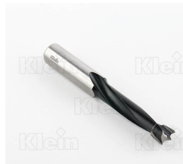
СВЕРЛА ИЗ КОМПОНЕНТОВ HW ДЛЯ ГЛУБОКИХ ОТВЕРСТИЙ Z = 2