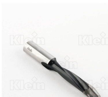
КОМПОНЕНТНЫЕ СВЕРЛА HW ДЛЯ СЕРИИ "ЕТ" Z = 2 ПРОХОДНЫХ ОТВЕРСТЯ