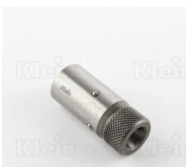
СВЕРЛИЛЬНЫЕ ПАТРОНЫ ДЛЯ БЫСТРОЙ ЗАМЕНА