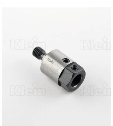
ШПИНДЕЛИ С РЕЗЬБОВЫМ СОЕДИНЕНИЕМ - (M8 / 9x3)