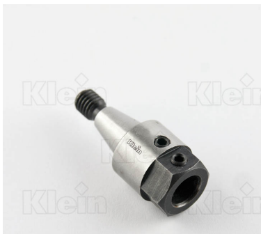
ШПИНДЕЛИ С РЕЗЬБОВЫМ СОЕДИНЕНИЕМ - (M8 / 20 ° 48 ')