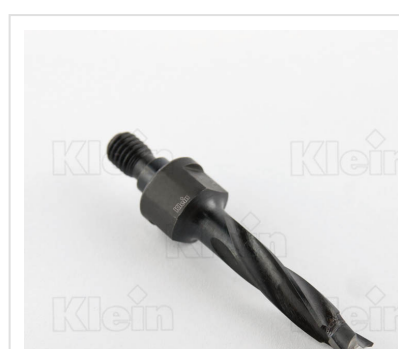
БЛОКИРОВКИ HW БЕЗ ПОВЕРХНОСТИ Z = 2