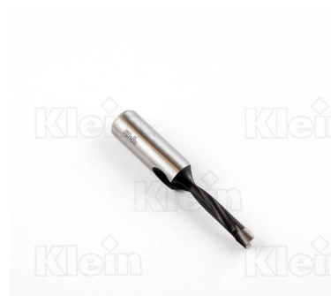
СВЕРЛА ДЛЯ ГЛУБОКИХ ОТВЕРСТИЙ «EF» Z = 2