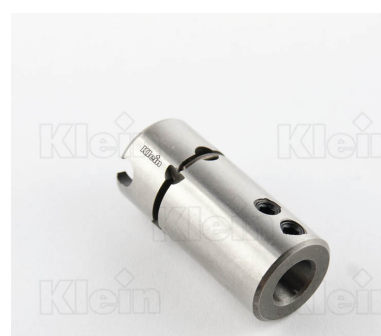
СВЕРЛИЛЬНЫЕ ПАТРОНЫ ДЛЯ БЫСТРОЙ ЗАМЕНА