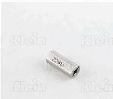
ВТУЛКИ ДЕРЖАТЕЛЯ НАКОНЕЧНИКОВ