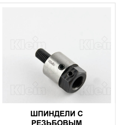
ШПИНДЕЛИ С РЕЗЬБОВЫМ СОЕДИНЕНИЕМ - (M8)