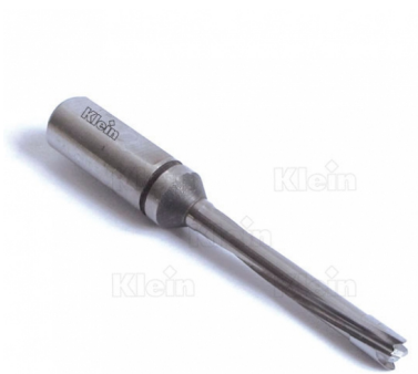
МОДУЛЬНЫЕ НАКОНЕЧНИКИ ДЛЯ ГЛУБОКИХ ОТВЕРСТИЙ INTEGRAL HW Z = 2 + 2