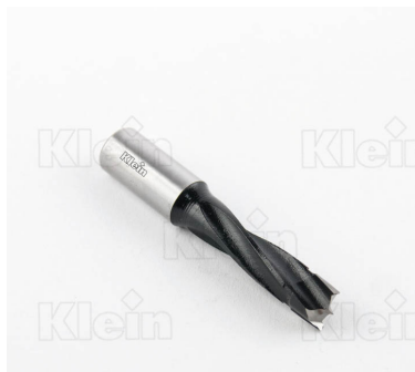
СВЕРЛА ИЗ КОМПОНЕНТОВ HW ДЛЯ ГЛУБОКИХ ОТВЕРСТИЙ Z = 2