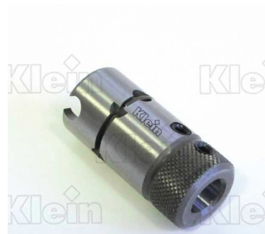
СВЕРЛИЛЬНЫЕ ПАТРОНЫ ДЛЯ БЫСТРОЙ ЗАМЕНА