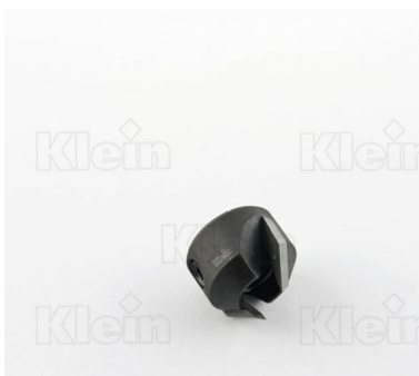
СЧЕТЧИКИ HW Z = 2