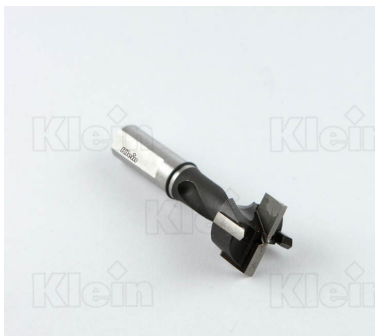
СОВЕТЫ ДЛЯ HW Z = 2 + 2 ПЕТЛИ