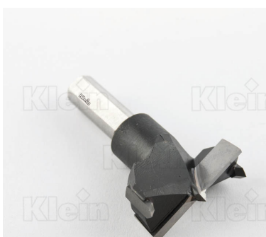
СОВЕТЫ ДЛЯ HW Z = 2 + 2 ПЕТЛИ