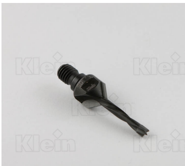
HW ДОПОЛНИТЕЛЬНЫЕ КОЛОНКИ С ПЕРЕГОРОДКОЙ Z = 2