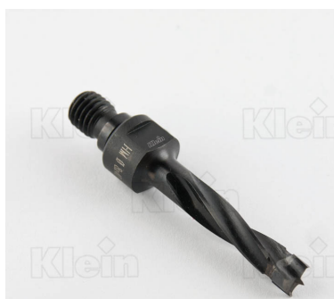
БЛОКИРОВКИ HW БЕЗ ПОВЕРХНОСТИ Z = 2