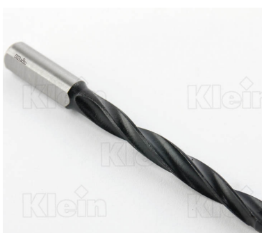
СВЕРЛА ИЗ КОМПОНЕНТОВ HW ДЛЯ ГЛУБОКИХ ОТВЕРСТИЙ Z = 2