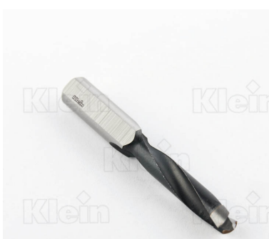
СВЕРЛА ДЛЯ ГЛУБОКИХ ОТВЕРСТИЙ «ET» Z = 2