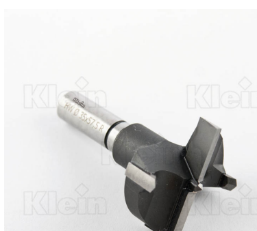
СОВЕТЫ ДЛЯ HW Z = 2 + 2 ПЕТЛИ