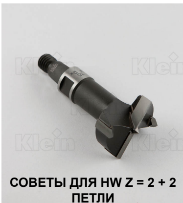
СОВЕТЫ ДЛЯ HW Z = 2 + 2 ПЕТЛИ