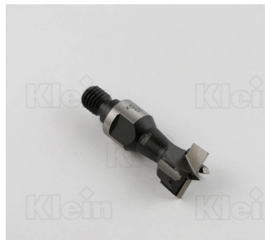
СОВЕТЫ ДЛЯ HW Z = 2 + 2 ПЕТЛИ