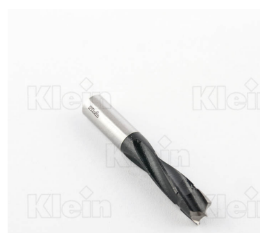
СВЕРЛА ИЗ КОМПОНЕНТОВ HW ДЛЯ ГЛУБОКИХ ОТВЕРСТИЙ Z = 2