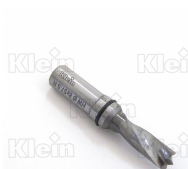
СВЕРЛА ДЛЯ ГЛУБОКИХ ОТВЕРСТИЙ «ET» Z = 2