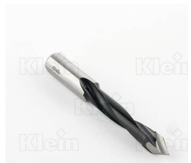
КОМПОНЕНТНЫЕ СВЕРЛА HW ДЛЯ ПРОХОДНЫХ ОТВЕРСТИЙ Z = 2