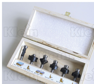
НАБОР РЕВЕРСИВНЫХ РЕЗАКОВ "РАСШИРЕННЫЙ" АССОРТИМЕНТ