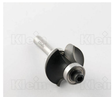
HW ФРЕЗЫ С ДВОЙНЫМ РАДИУСОМ С ПОДШИПНИКОМ Z = 2