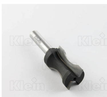
ФРЕЗЫ HW ФАСОННЫЕ Z = 2