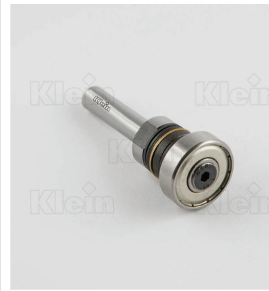
ШПИНДЕЛЬ ДЛЯ ВЫДВИЖНЫХ ФРЕЗОВ