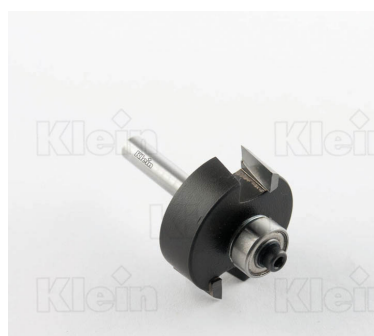
СТАЛЬНЫЕ ФРЕЗЫ HW С ПОДШИПНИКОМ Z = 2