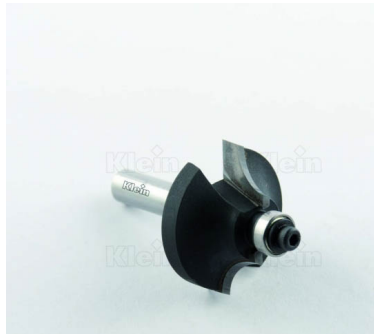
ФРЕЗЫ HW С ОВАЛЬНЫМ ПРОФИЛЕМ С ПОДШИПНИКОМ Z = 2