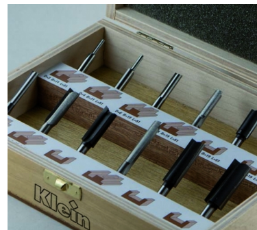
НАБОР ИЗ 12 ПРЕДМЕТОВ В АССОРТИМЕНТЕ "РАСШИРЕННЫЕ КАНАЛЫ"