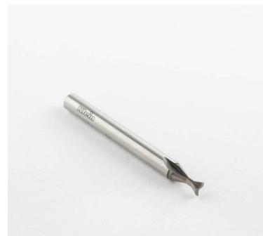
ТВЕРДЫЕ ФРЕЗЫ ДЛЯ Z = 2 ПРОКЛАДКИ С ДВИГАТЕЛЕМ