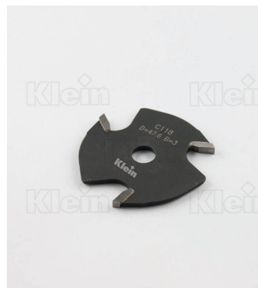
HW ФРЕЗЫ ДЛЯ МАЛЫХ СОЕДИНЕНИЙ