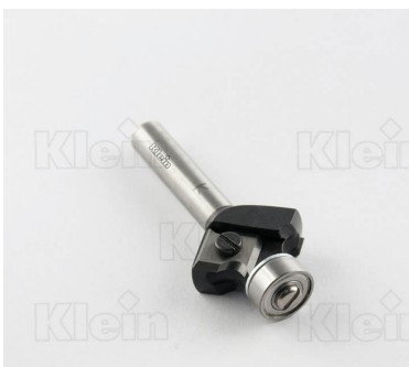
HW ФРЕЗЫ ДЛЯ СВОЙКИ С ПОДШИПНИКОМ Z = 2