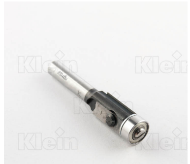
HW ФРЕЗЫ С ПРЯМЫМИ ФРЕЗАМИ С ПОДШИПНИКОМ