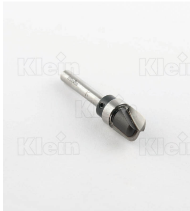
HW ФРЕЗЫ С ВЕРХНИМ ПОДШИПНИКОМ Z = 2