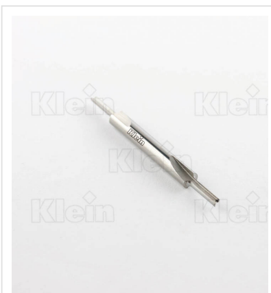
HW ТВЕРДЫЕ ДВУСТОРОННИЕ ФРЕЗЫ