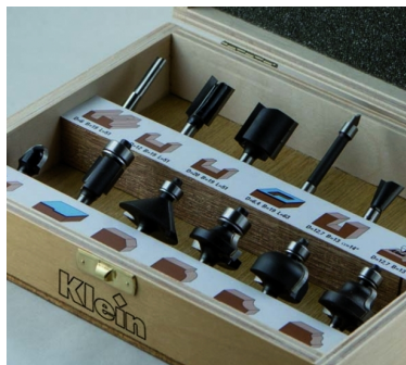
НАБОР ИЗ 12 ПРЕДМЕТОВ В АССОРТИМЕНТЕ HW "СТАНДАРТ"