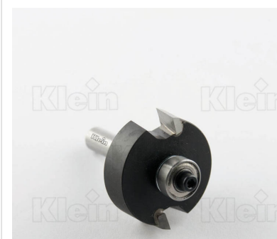
НАБОР СТАЛЬНЫХ ФРЕЗОВ HW С ПОДШИПНИКАМИ Z = 2