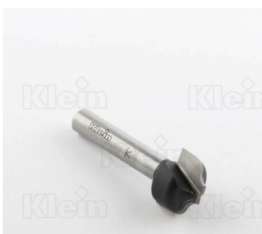
ФРЕЗЫ С ДВОЙНЫМ РАДИУСОМ Z = 2