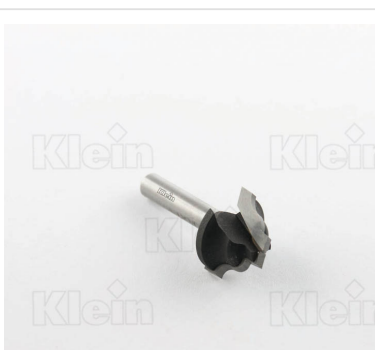
ФРЕЗЫ С ДВОЙНЫМ РАДИУСОМ Z = 2