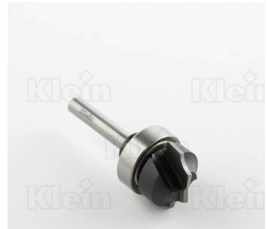
HW ФРЕЗЫ С ВЕРХНИМ ПОДШИПНИКОМ Z = 2