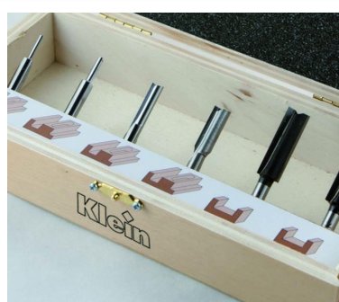
НАБОР ИЗ 6 ПРЕДМЕТОВ В АССОРТИМЕНТЕ "БАЗОВЫЕ КАНАЛЫ"