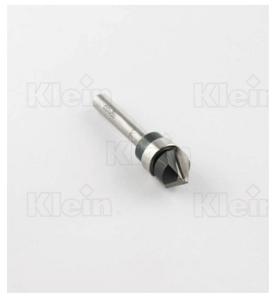
HW A "V" ФРЕЗЫ С ВЕРХНИМ ПОДШИПНИКОМ Z = 2