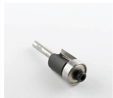
ФРЕЗЫ HW С ОСЕВОЙ ПРЯМОЙ ФРЕЗОЙ С ПОДШИПНИКОМ Z = 2