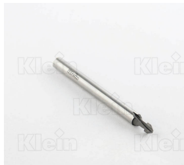
HW РЕЗАКИ ДЛЯ ТРАПЕЦОИДНЫХ ПРОКЛАДOK Z = 2