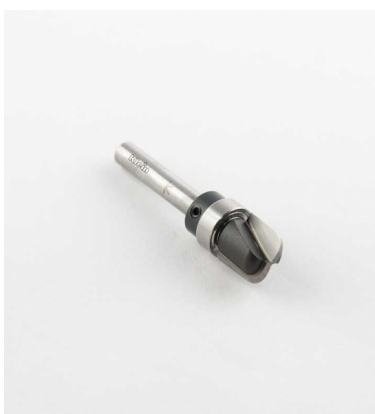
HW РЕЗАКИ ДЛЯ ЧАШЕК И ПОДДОНОВ С ВЕРХНИМ ПОДШИПНИКОМ Z = 2