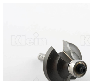
HW ФРЕЗЫ С ДВОЙНЫМ РАДИУСОМ С ПОДШИПНИКОМ Z = 2