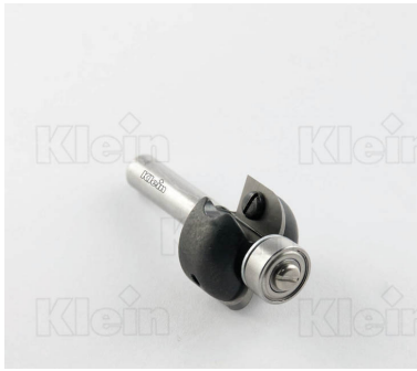
HW ФРЕЗЫ С ВЫПУСКНЫМ РАДИУСОМ С ПОДШИПНИКОМ Z = 2