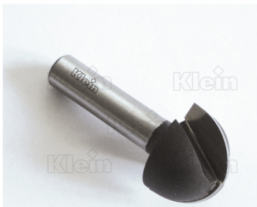
ФРЕЗЫ HW С ВЫПУСКНЫМ РАДИУСОМ Z = 2