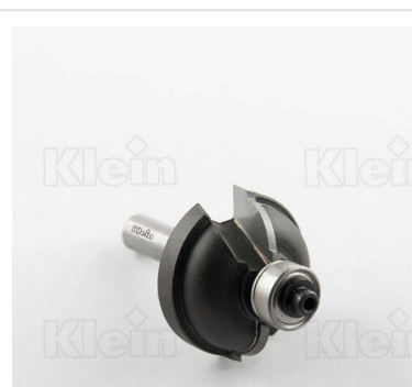
HW ФРЕЗЫ С ВЫПУСКНЫМ РАДИУСОМ С ПОДШИПНИКОМ Z = 2