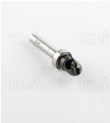
ФРЕЗЫ HW С ВЫПУСКНЫМ РАДИУСОМ Z = 1