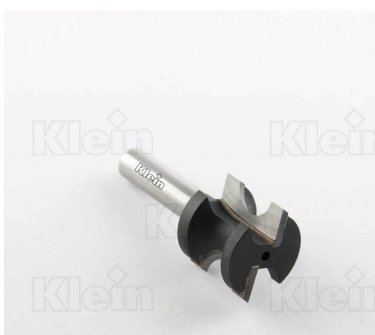
ПОЛУКРУГЛЫЕ ФРЕЗЫ HW ФОРМЫ Z = 2