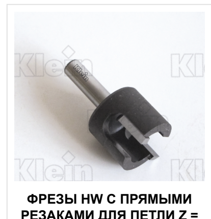
ФРЕЗЫ HW С ПРЯМЫМИ РЕЗАКАМИ ДЛЯ ПЕТЛИ Z =