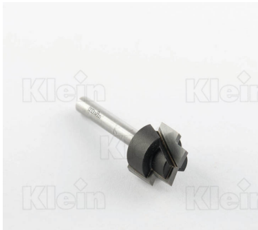
ФРЕЗЫ HW СО ШАГОМ Z = 2