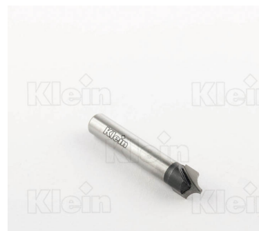
ФРЕЗЫ HW С РАДИУСОМ Вогнутости Z = 2