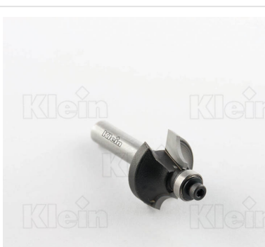
HW ФРЕЗЫ С РАДИУСОМ Вогнутости С ПОДШИПНИКОМ Z = 2