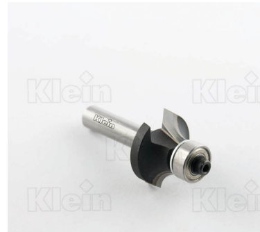
HW ФРЕЗЫ С РАДИУСОМ Вогнутости С ПОДШИПНИКОМ Z = 2