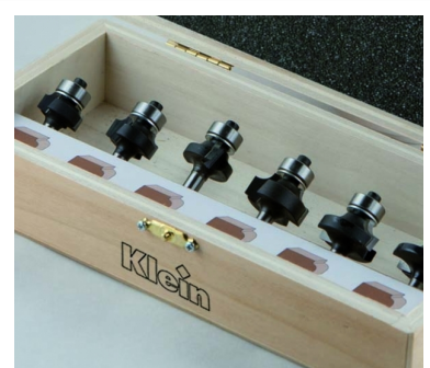
НАБОР ИЗ 6 ПРЕДМЕТОВ В АССОРТИМЕНТЕ "БАЗОВЫЕ СПИЦЫ"