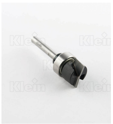
HW ФРЕЗЫ С ВЕРХНИМ ПОДШИПНИКОМ Z = 2