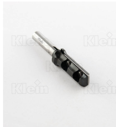
ФРЕЗЫ ДЛЯ КАНАЛОВ Z = 1