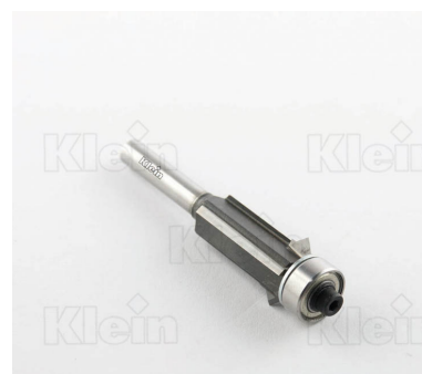
HW ФРЕЗЫ ДЛЯ ПОДРЕЗКИ С ПОДШИПНИКОМ Z = 2