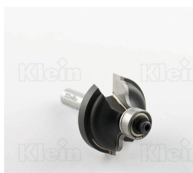
HW ФРЕЗЫ С ДВОЙНЫМ РАДИУСОМ С ПОДШИПНИКОМ Z = 2