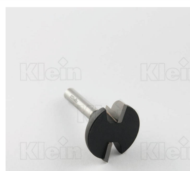
HW РЕЗАКИ С ОТРИЦАТЕЛЬНЫМ РАДИУСОМ Z = 2