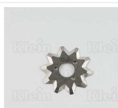
ТРИММЕР ДЛЯ РУЧНЫХ ОБРАБОТЧИКА КРОМКИ В HS