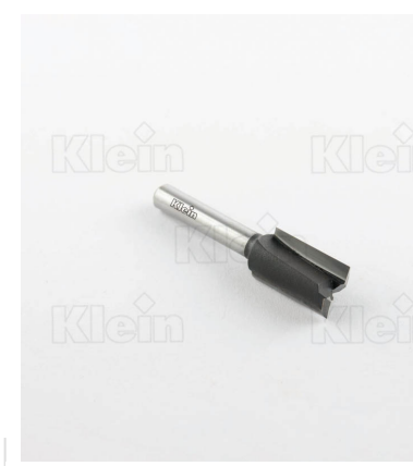
HW РЕЗАКИ ДЛЯ КАНАЛОВ