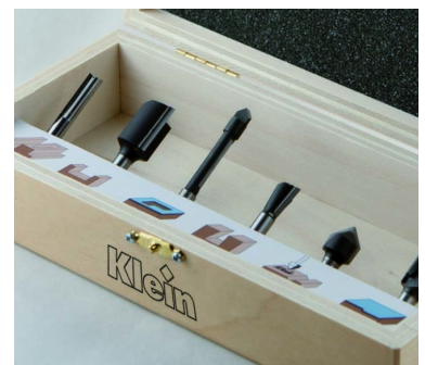
НАБОР ИЗ 6 ПРЕДМЕТОВ В АССОРТИМЕНТЕ "ОТДЕЛКА-ОСНОВАНИЕ СОЕДИНЕНИЙ"