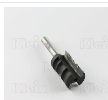
МНОГОПРОФИЛЬНЫЕ ФРЕЗЫ Z = 2