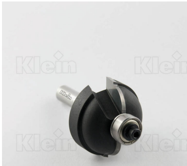
HW ФРЕЗЫ С ВЫПУСКНЫМ РАДИУСОМ С ПОДШИПНИКОМ Z = 2