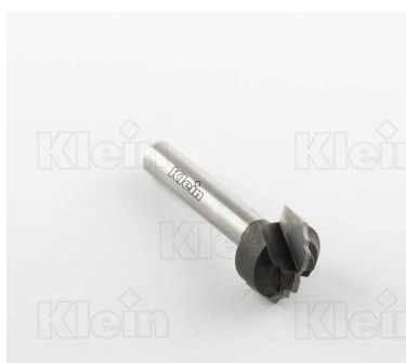
ФАСОННЫЕ ФРЕЗЫ HW С РАДИУСОМ Вогнутости Z = 2