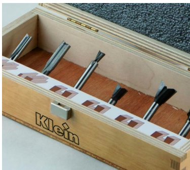
НАБОР ИЗ 6 ПРЕДМЕТОВ В АССОРТИМЕНТЕ "ОСНОВНЫЕ СОЕДИНЕНИЯ"