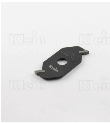
HW ФРЕЗЫ ДЛЯ МАЛЫХ СОЕДИНЕНИЙ