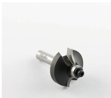
HW РАДИУСНЫЕ ФРЕЗЫ Вогнутые с подшипником Z = 2