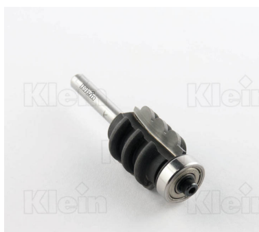
HW ФРЕЗЫ С ТРОЙНЫМ РАДИУСОМ С ПОДШИПНИКОМ Z = 2