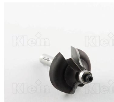
HW ФРЕЗЫ С ДВОЙНЫМ РАДИУСОМ С ПОДШИПНИКОМ Z = 2