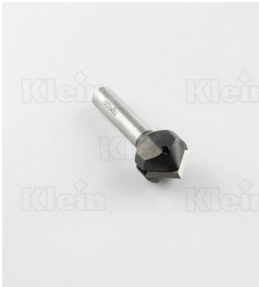
ФРЕЗЫ HW С V-образным профилем Z = 1