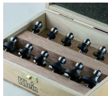
НАБОР ИЗ 12 ПРЕДМЕТОВ В АССОРТИМЕНТЕ "ADVANCED SPOKES"