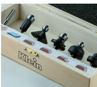
НАБОР ИЗ 6 ПРЕДМЕТОВ В АССОРТИМЕНТЕ "BASE MOLDING"