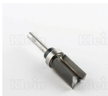
HW ФРЕЗЫ С ВЕРХНИМ ПОДШИПНИКОМ Z = 2