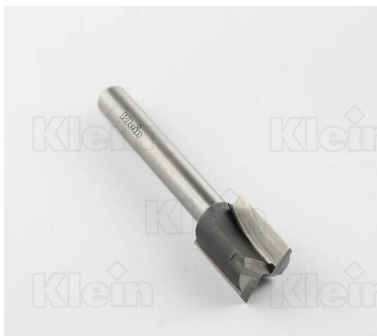
СВЕРЛА HW ДЛЯ ФРЕЗЕРНОГО СТАНКА "ELU"