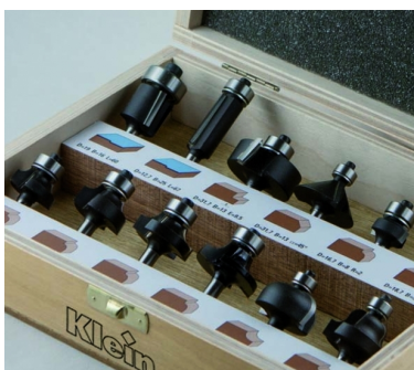
НАБОР ИЗ 12 ПРЕДМЕТОВ В АССОРТИМЕНТЕ HW "ADVANCED MOLDING"