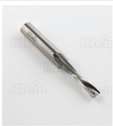
КУСАЧКИ S = 8 HW ИНТЕГРАЛЬНАЯ ЛЕВАЯ СПРАВА Z = 2