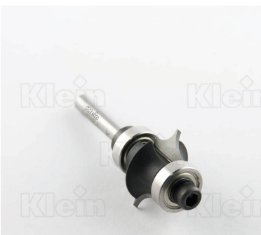
ДВОЙНЫЕ ПОДШИПНИКИ ДЛЯ ДЕКОРАЦИИ Z = 2