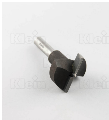
ТОЧКИ ДЛЯ ПЕТЛИ ТИПА "ХОББИ"