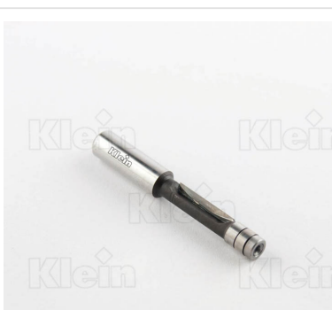
HW ФРЕЗЫ ДЛЯ ПУГОЛЬНИКОВ С ПОДШИПНИКОМ Z = 1