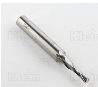
ФРЕЗЫ S = 8 HW ИНТЕГРАЛЬНАЯ ПРАВЯЯ СПРАВОЧНАЯ Z = 2