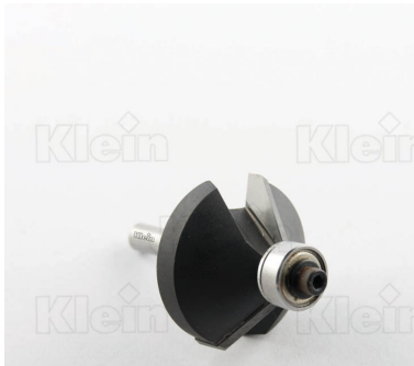
HW ФРЕЗЫ ДЛЯ СВОЙКИ С ПОДШИПНИКОМ Z = 2