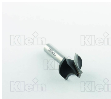
ФРЕЗЫ HW С РАДИУСОМ Вогнутости Z = 2