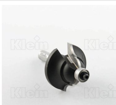
HW ФРЕЗЫ С ДВОЙНЫМ РАДИУСОМ С ПОДШИПНИКОМ Z = 2