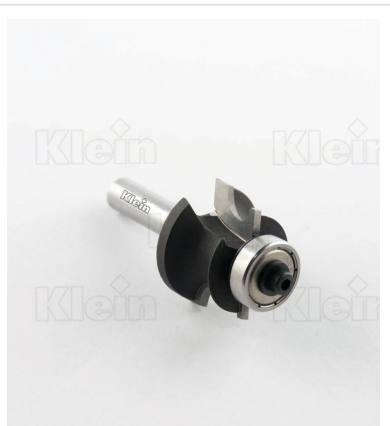
HW ФРЕЗЫ ДЛЯ ДЕКОРАЦИИ С ПОДШИПНИКОМ Z = 2