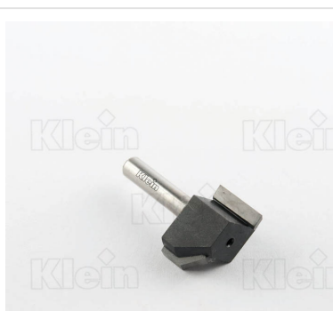
ФРЕЗЫ HW С КОМБИНИРОВАННЫМИ ФРЕЗАМИ Z = 2