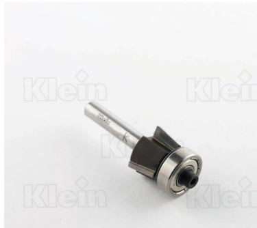
HW ФРЕЗЫ ДЛЯ ЗАБОРАНИЯ С ПОДШИПНИКОМ