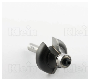
HW ФРЕЗЫ С ДВОЙНЫМ РАДИУСОМ С ПОДШИПНИКОМ Z = 2