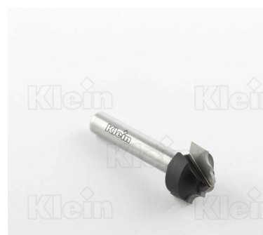
ФРЕЗЫ С ДВОЙНЫМ РАДИУСОМ СТРОИТЕЛЬНОЙ ФОРМЫ Z = 2