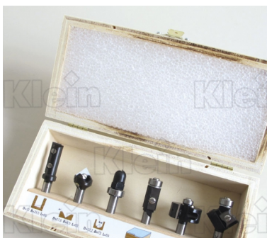
НАБОР РЕЗАКОВ С ПЕРЕКЛЮЧАТЕЛЬНЫМИ НОЖАМИ "БАЗА" В АССОРТИМЕНТЕ