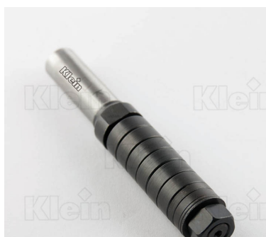
ШПИНДЕЛЬ ДЛЯ РЕЗКИ