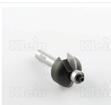
HW ФРЕЗЫ С ВЫПУСКНЫМ РАДИУСОМ С ПОДШИПНИКОМ Z = 2