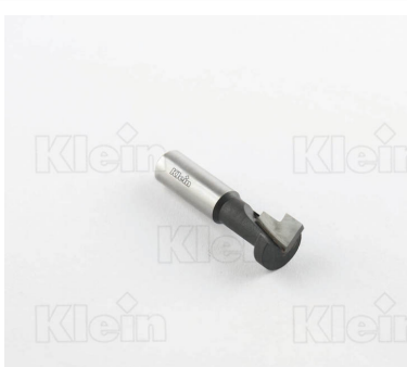
ФРЕЗЫ ДЛЯ КОРПУСА КЛЮЧА Z = 1