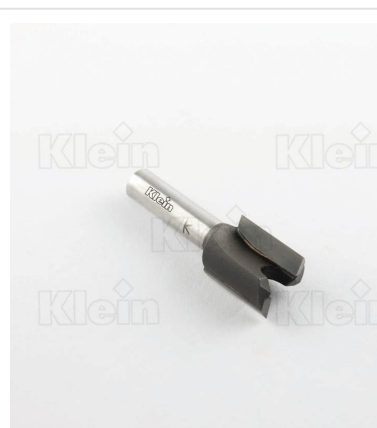
ФРЕЗЫ HW С ПРЯМЫМИ ФРЕЗАМИ Z = 2