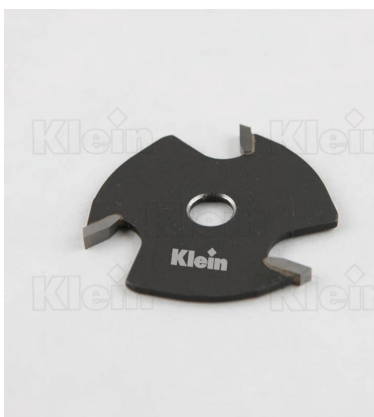
ФРЕЗЫ ДЛЯ КАНАВОВ С СКРЫТЫМ ЗАЖИМОМ