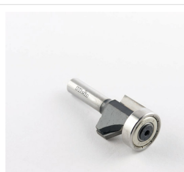
ФРЕЗЫ HW С КОМБИНИРОВАННЫМИ ФРЕЗАМИ С ПОДШИПНИКОМ Z = 2