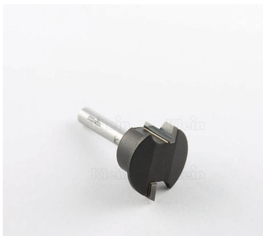
ФРЕЗЫ HW ДЛЯ СОЕДИНЕНИЙ ЯЩИКОВ Z = 2