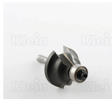
ФРЕЗЫ HW С ГОФРИРОВАННЫМ ПРОФИЛЕМ С ПОДШИПНИКОМ