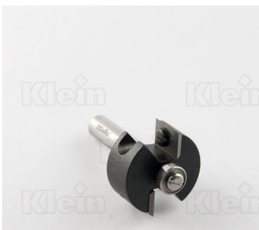
СТАЛЬНЫЕ ФРЕЗЫ HW С ПОДШИПНИКОМ Z = 2