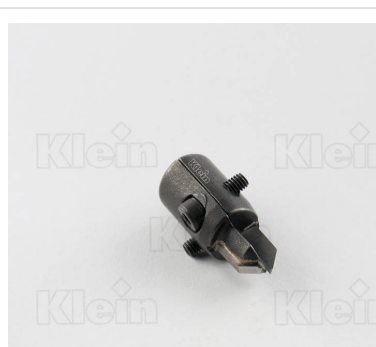
HW РЕГУЛИРУЕМЫЕ СЧЕТЧИКИ Z = 2