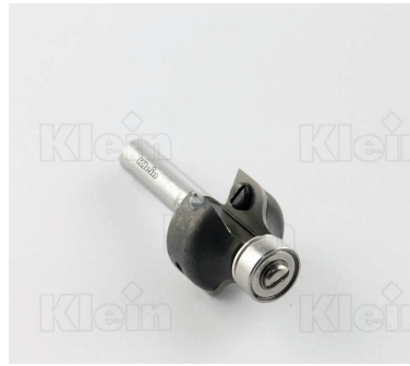
HW ФРЕЗЫ С ДВОЙНЫМ РАДИУСОМ С ПОДШИПНИКОМ Z = 2