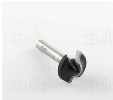
HW КРУГЛЫЕ РЕЗКИ С ДВОЙНЫМ РАДИУСОМ Z = 2