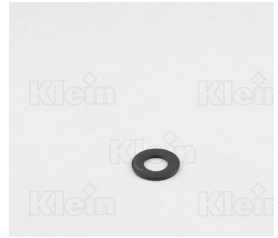
РАССТОЯНИЕ И ТОЛЩИНА