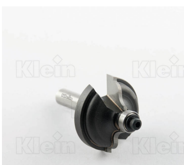
HW ФРЕЗЫ С ДВОЙНЫМ РАДИУСОМ С ПОДШИПНИКОМ Z = 2