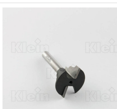
ФРЕЗЫ С ДВОЙНЫМ РАДИУСОМ Z = 2