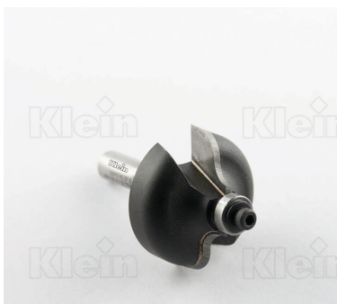
HW ФРЕЗЫ С ДВОЙНЫМ РАДИУСОМ С ПОДШИПНИКОМ Z = 2