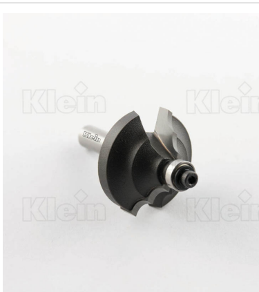
HW ФРЕЗЫ С ДВОЙНЫМ РАДИУСОМ С ПОДШИПНИКОМ Z = 2