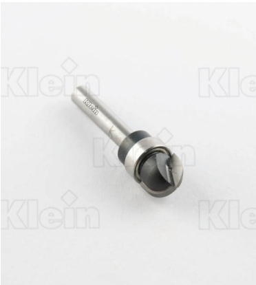
HW ФРЕЗЫ С ВЫПУСКНЫМ РАДИУСОМ С ВЕРХНИМ