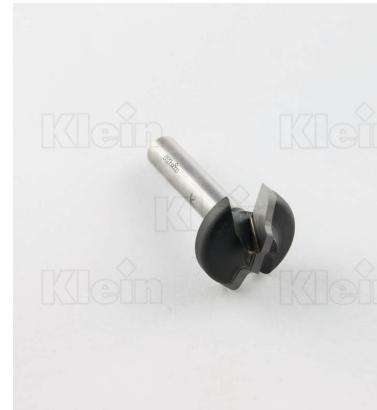
HW ФРЕЗЫ С ДВОЙНЫМ РАДИУСОМ ПЛОСКОЙ ТОЧКИ Z = 2