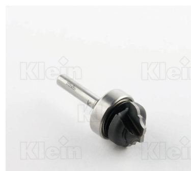
HW ФРЕЗЫ С ВЕРХНИМ ПОДШИПНИКОМ Z = 2