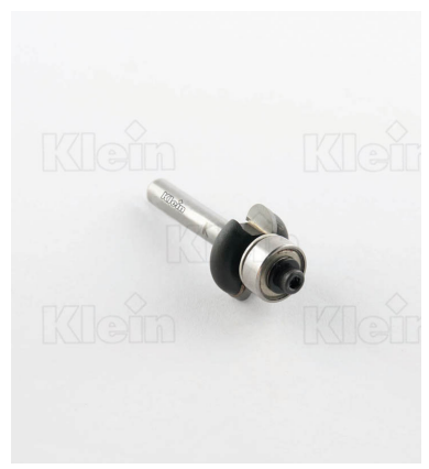
HW ПОЛУКРУГЛЫЕ ФРЕЗЫ С ПОДШИПНИКОМ Z = 2