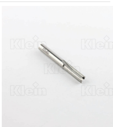
ИНТЕГРАЛЬНЫЕ РЕЗКИ HW КАНАЛОВ

К фрезам для переносных пантографов относятся: фрезы по дереву, профильные фрезы, аяные фрезы, сплошные фрезы, радиусные фрезы, по резные фрезы, гравировальные фрезы, контурные фрезы, комплект радиальных фрез, набор фрез фрезы для снятия фасок, регулируемая зенковка