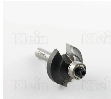
HW ФРЕЗЫ С ДВОЙНЫМ РАДИУСОМ С ПОДШИПНИКОМ Z = 2