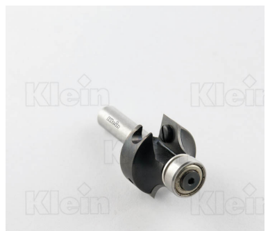
ФРЕЗЫ HW С РАДИУСОМ Вогнутости Z = 2