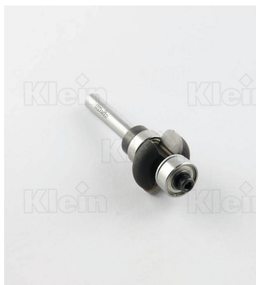
HW CUTTERS ПОЛОВИНА КРУГЛЫЙ ДВОЙНОЙ ПОДШИПНИК Z = 2