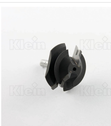
ФРЕЗЫ HW ДЛЯ СОЕДИНЕНИЙ 90 ° Z = 2