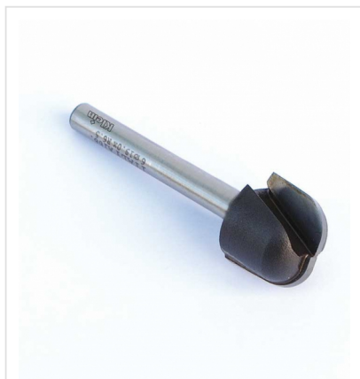
НВ РЕЗКИ ДЛЯ ЧАШЕК И ПОДДОНОВ Z = 2