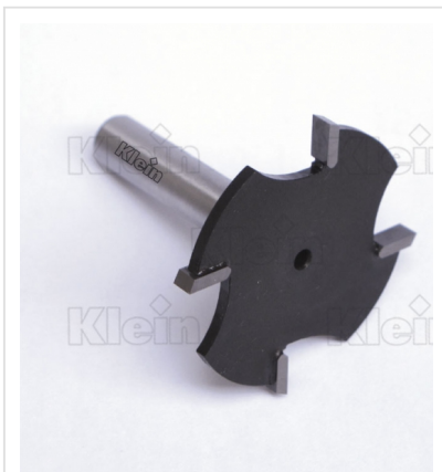
"Т" ГОРЕЛКИ Z = 4