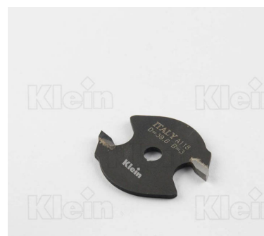
HW ФРЕЗЫ ДЛЯ МАЛЫХ СОЕДИНЕНИЙ