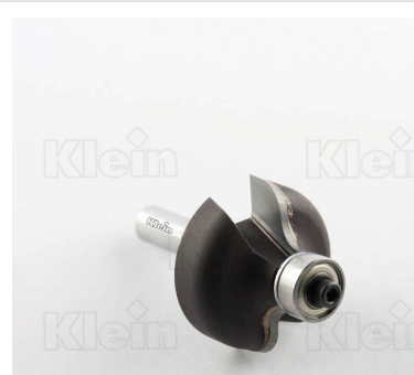
HW ФРЕЗЫ С ДВОЙНЫМ РАДИУСОМ С ПОДШИПНИКОМ Z = 2