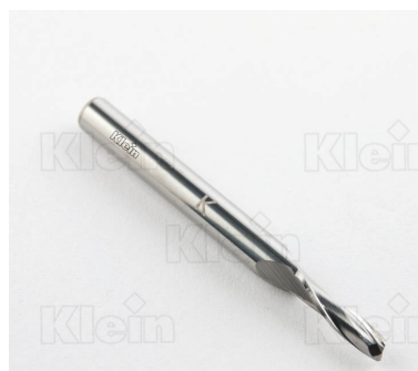
КУСАЧКИ S = 6 HW ИНТЕГРАЛЬНАЯ ПРАВЯЯ СПРАВА Z = 2