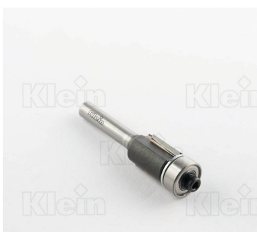
ФРЕЗЫ HW С ПРЯМЫМИ ФРЕЗАМИ С ПОДШИПНИКОМ Z = 2