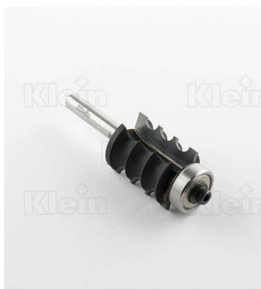
HW ФРЕЗЫ С ТРОЙНЫМ РАДИУСОМ С ПОДШИПНИКОМ Z = 2