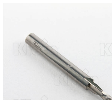
ФРЕЗЫ S = 6 HW ИНТЕГРАЛЬНАЯ ЛЕВАЯ СПРАВА Z = 2