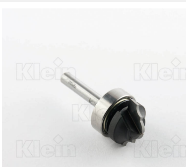
HW ФРЕЗЫ С ВЕРХНИМ ПОДШИПНИКОМ Z = 2