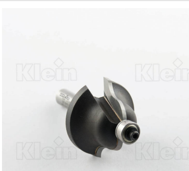
HW ФРЕЗЫ С ДВОЙНЫМ РАДИУСОМ С ПОДШИПНИКОМ Z = 2