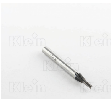
ТВЕРДЫЕ РЕЗКИ ДЛЯ ПРЯМЫХ ПРОКЛАДOK Z = 2