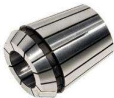
Цанга зажимная высокоточная Klein ER25 (d7-6 D26 L34)