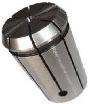
Цанга зажимная высокоточная Klein OZ25 (d20-19,5 D35 L52)