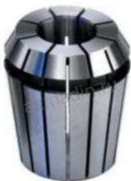
Цанга зажимная высокоточная Klein ER40 (d20-19 D41 L46)