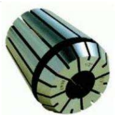
Цанга зажимная высокоточная Klein ER32 (d20-19 D33 L40)