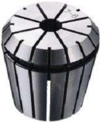
Цанга зажимная высокоточная Klein ER16 (d7-6 D17 L28)