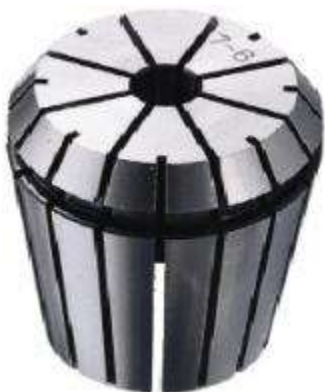
Цанга зажимная высокоточная Klein ER16 (d3-2 D17 L28)