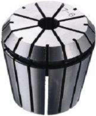
Цанга зажимная высокоточная Klein ER16 (d6-5 D17 L28)